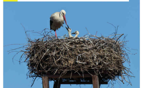
21 Die Storch-Hütte

* Die Info-Texte finden Sie in einer Broschüre und auf der Website.