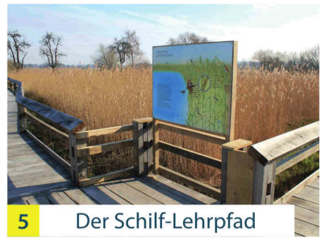
5 Der Schilf-Lehrpfad