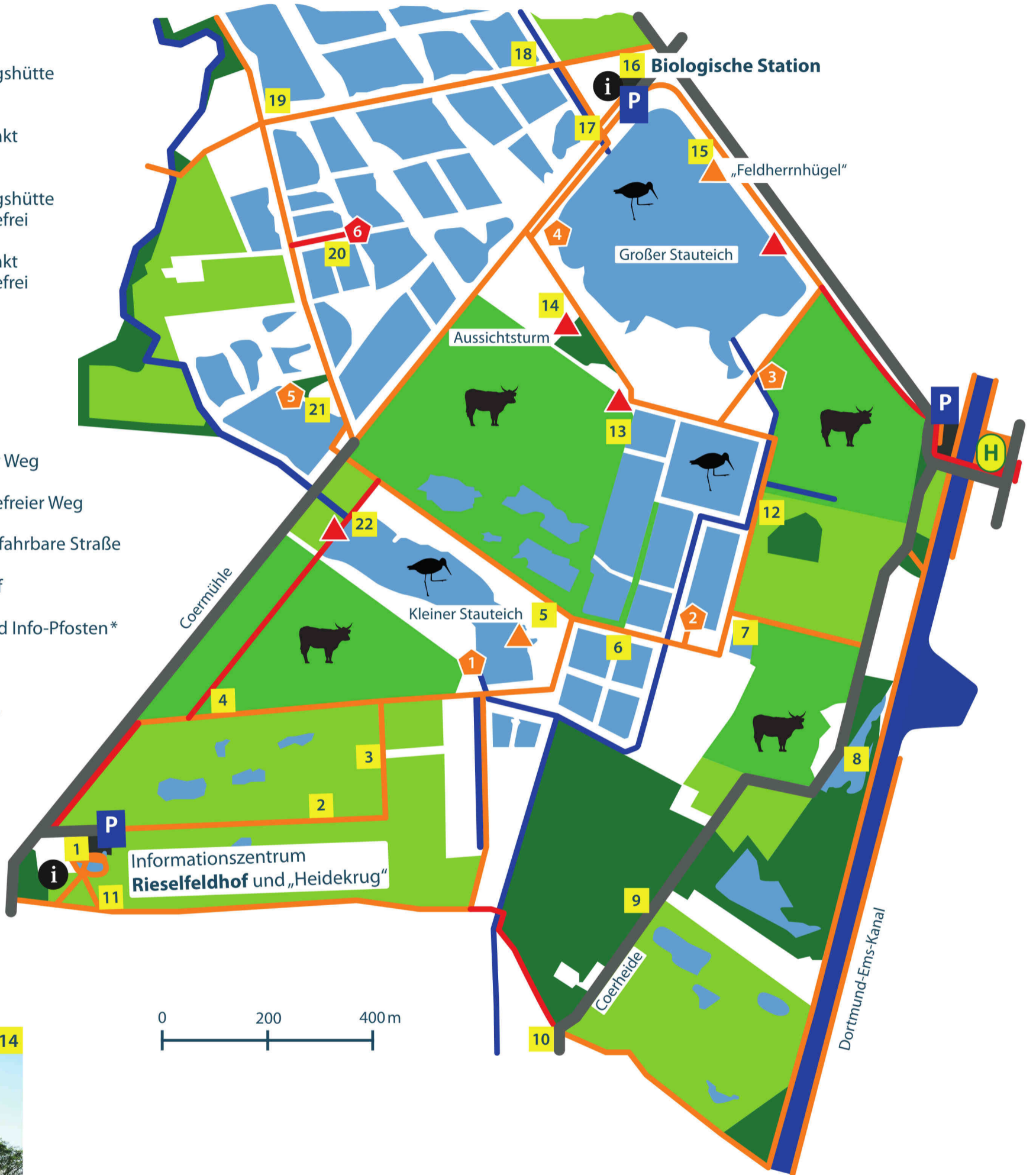
Der Aussichtsturm 14