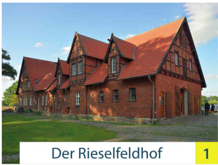
Der Rieselfeldhof 1